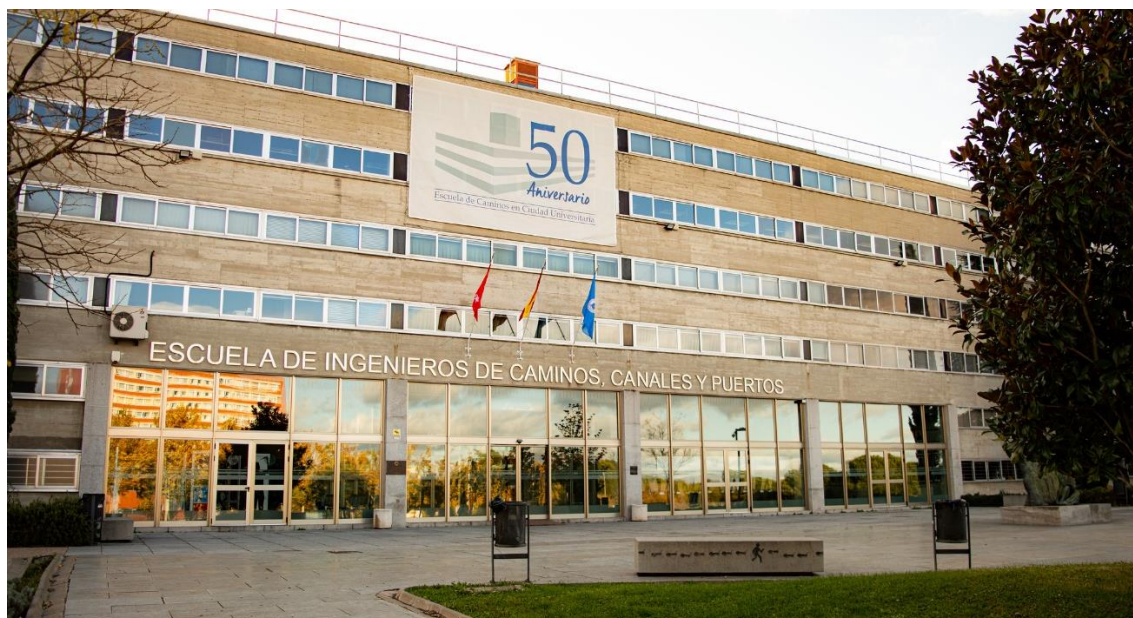
Imagen de la entrada principal de la escuela.

El edificio se encuentra en la Ciudad Universitaria, donde se ubican la mayoría de facultades de la Universidad Politécnica de Madrid y la Universidad Complutense.