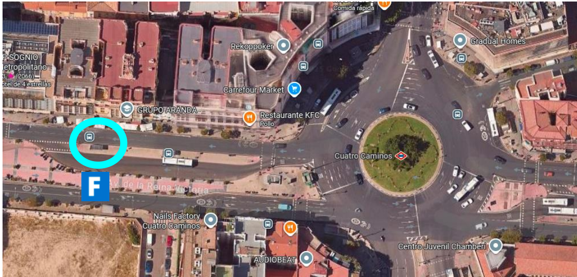
Ubicación de la parada del autobús F en la glorieta de Cuatro Caminos.

La glorieta de Cuatro Caminos también cuenta con buenas conexiones en metro (líneas 1 y 2 ). Desde allí puede tomarse el autobús F en la parada 2480, yendo hasta la parada 4287 (Escuela de Caminos). No obstante, es peor opción que ir a Moncloa, pues está más lejos y solo hay una opción de autobús.